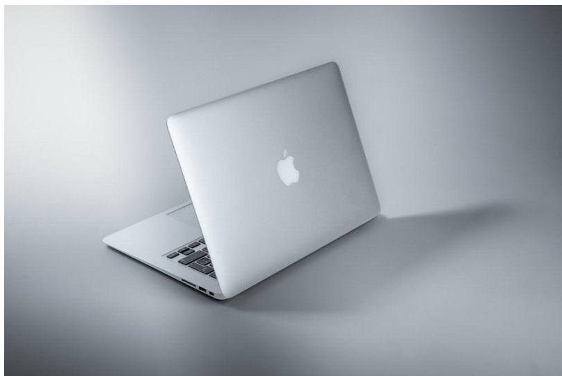
$ 5,000 Working for 5 year without any problem