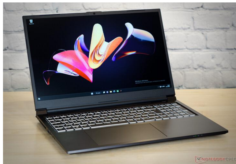
$ 15,00 Working for 1 year without any problem